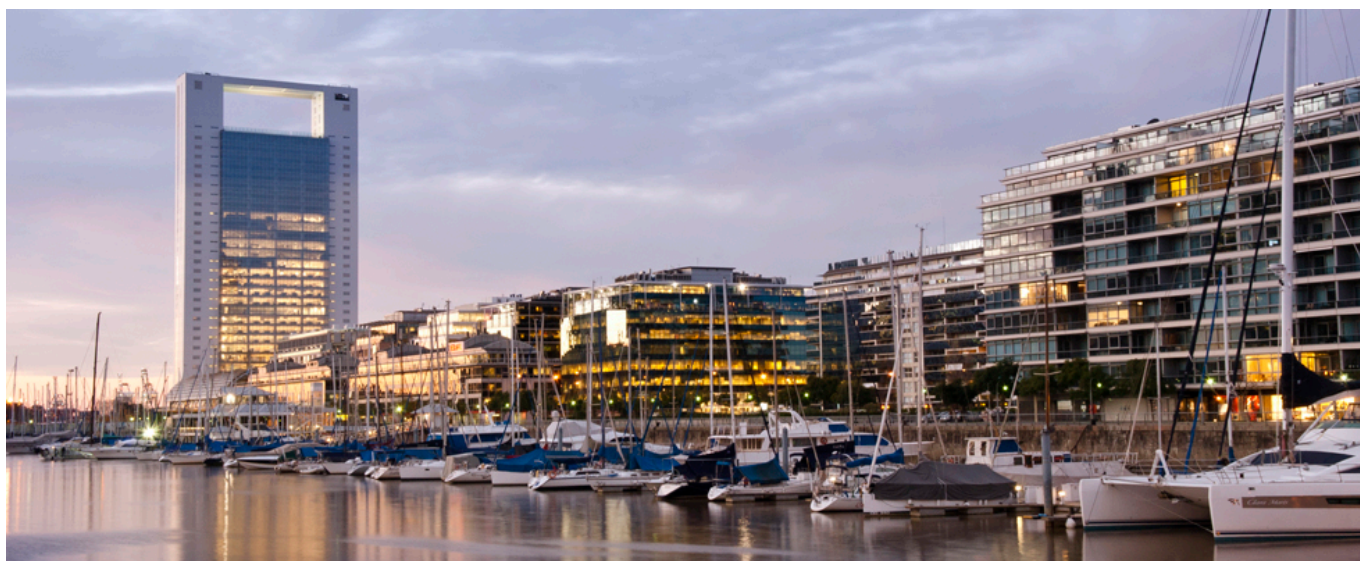
Puerto Madero, 2017.