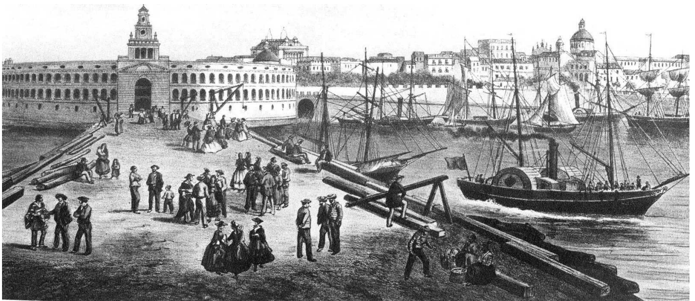
Muelles de arribo de cargas y la aduana, 1860.

Habiendo explicado que los barcos no podían acercarse demasiado a la costa y sus mercaderías llegaban por carretas que lo acercaban a la costa, un tiempo antes, en 1860, dos largos muelles que se introducían en el río permitieron crear el primer arribo formal y así la llegada de pasajeros y de cargas, donde un notable edificio semicircular definía la referencia frente al río del control de aduanas.