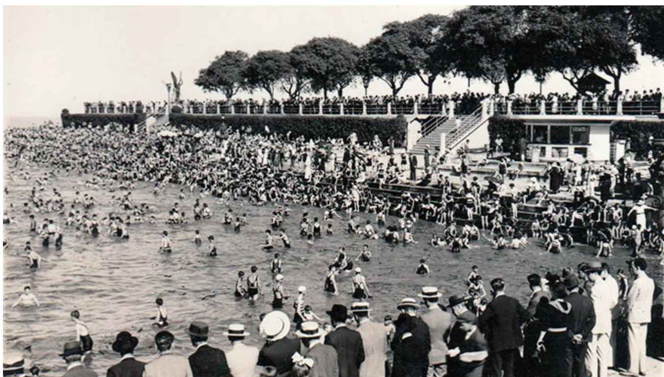
Balneario municipal de Buenos Aires, 1920.

Más tarde y luego de un relleno costero de más de 300 hectáreas, realizados durante los años 1970 a 1980, se creaba un gran Parque Ambiental denominado Reserva Ecológica, sobre el viejo balneario. Hoy y transcurrido el tiempo, con una arbolada vereda y una costa al río restaurada, se abre la posibilidad de una nueva ribera recreativa en el frente de agua de Buenos Aires.