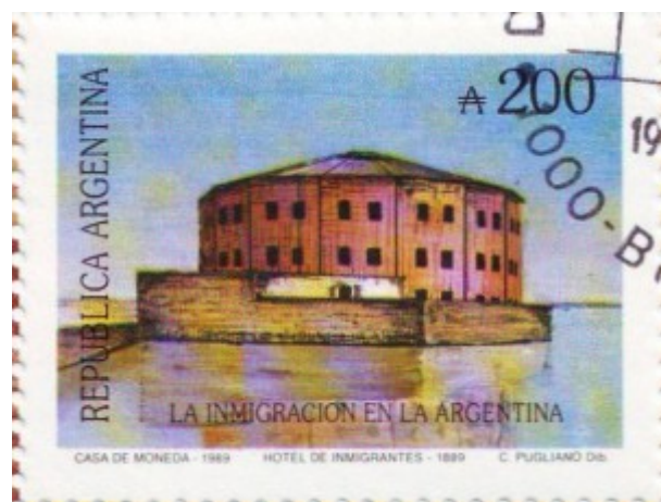
Hotel de inmigrantes.

Comienza un nuevo ciclo de gran transformación de Buenos Aires y el país, generando incluso, durante el fin del siglo XIX y las primeras décadas del siglo XX, un excepcional flujo inmigratorio de más de 3.000.000 personas, lo cual fue generando espacios de significación en el territorio frente al Río de la Plata, en función del enorme impacto producido por la enorme dimensión de nuevos habitantes llegados al Puerto de la ciudad.