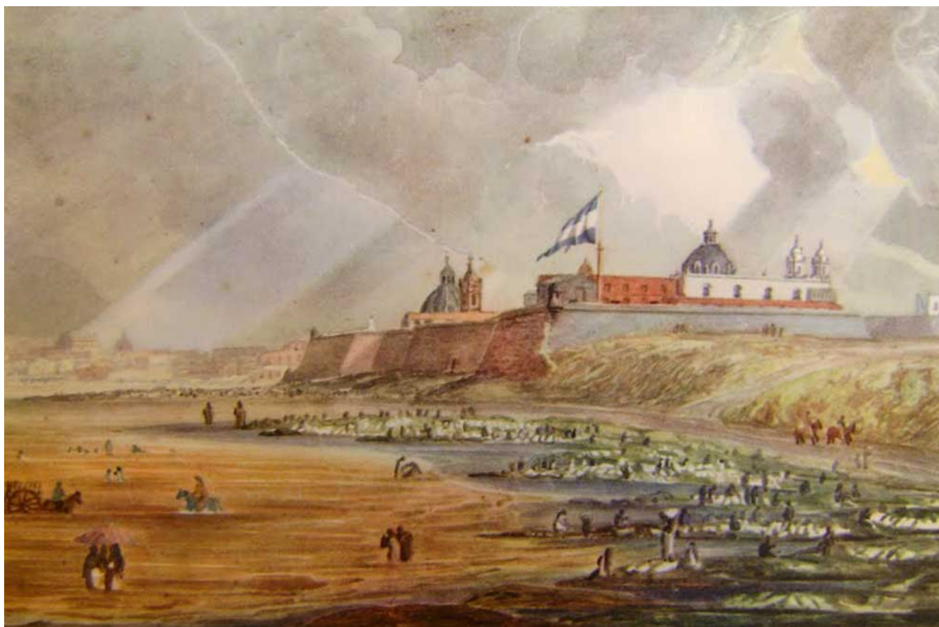
El fuerte, las playas bajas y el río en 1819.

Así y en ese contexto Buenos Aires, con una población de 24.205 habitantes, comenzaba a ser una ciudad comercial de significación, donde el puerto y la conexión con las ciudades del interior del Virreinato fueron un notable punto de organización del territorio nacional.