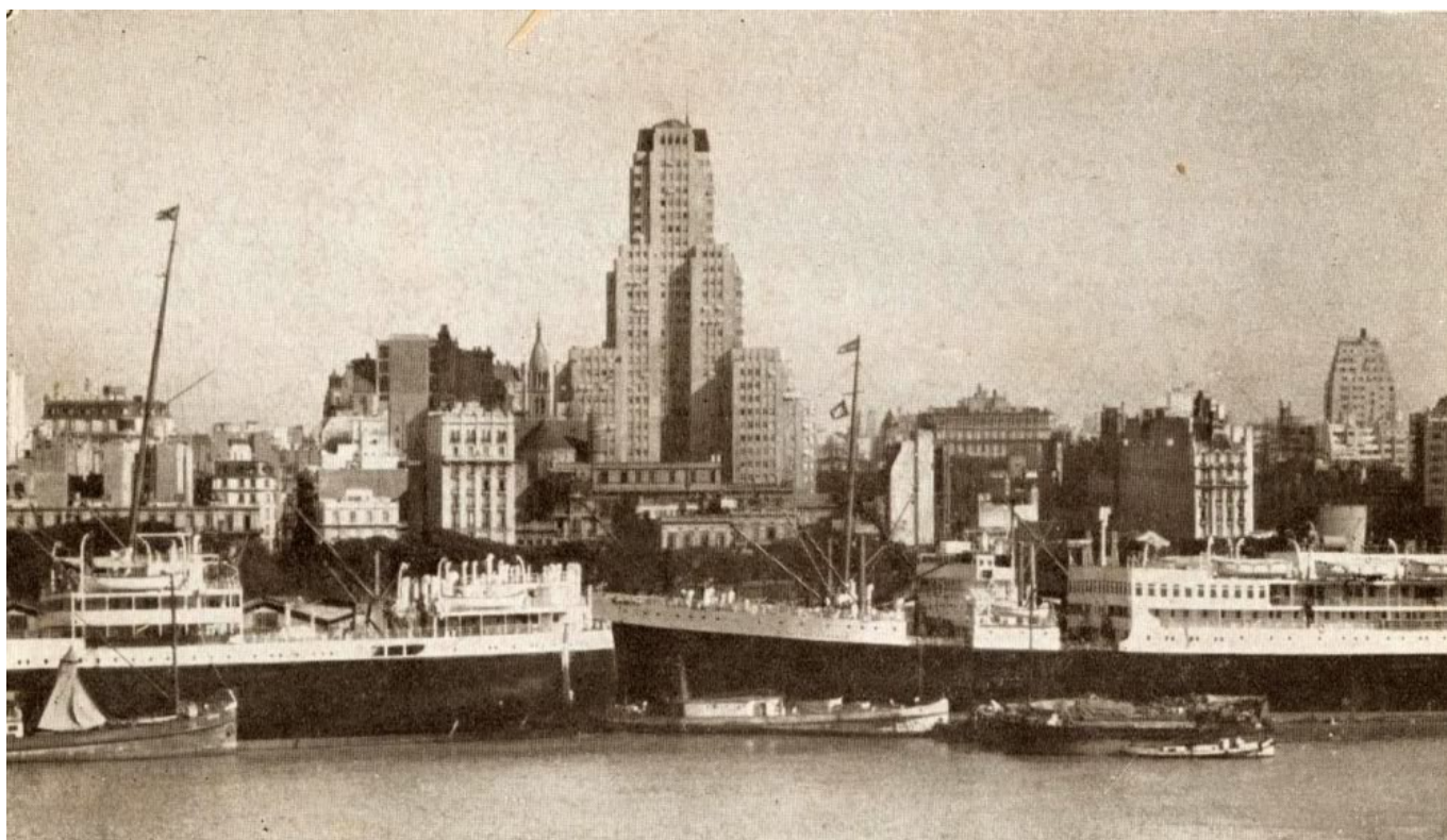
La dársena norte y el edificio Kavanagh en el centro de Buenos Aires de frente al río, 1950.

Hasta que en 1989 el Gobierno Nacional y el de la Ciudad firmaron el acta de constitución de la Corporación Antiguo Puerto Madero con la finalidad de generar un área de urbanización en 170 Hectáreas desafectadas de la actividad portuaria, logrando progresivamente constituir un moderno barrio, con viviendas, oficinas, hoteles, comercios, museos, universidad y parques, que lo han convertido en uno de los lugares principales de residencia, trabajo, visita y recreación de Buenos Aires.